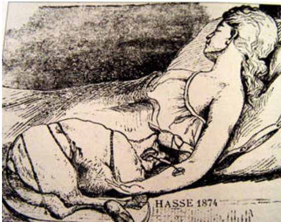
Bluttransfusion von Hund zu Frau

Die ersten Versuche von Bluttransfusionen gehen bis in das 17. Jahrhundert zurück. Da weder die Blutgerinnung noch die Blutgruppen bekannt waren, führten sie nicht zum Erfolg. Es kam zu Thrombosen, Embolie und zum tödlichen Schock. Anfangs wurde tierisches Blut vom Schaf, Lamm oder Hund auf den Mensch übertragen. Einen Transfusionsversuch zwischen zwei Hunden nahm der Arzt Richard Lower 1666 in Oxford vor..