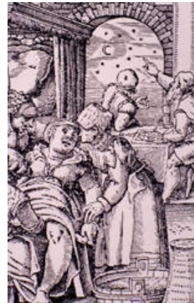
Geburt und Horoskop

Die Geschichte der Blutstillung wurde in der Humanmedizin geschrieben. Unendlich viele Menschen haben ihr Leben an der massiven Blutung verloren, durch Unfälle, Kriegsverletzungen und schwere Krankheiten. In unserer Welt bestehen diese Bedrohungen unvermindert fort, auch wenn die wissenschaftliche Medizin längst ein Mittel zu einer effektiven Blutstillung in die Hand gegeben hat. Der Tierarzt konnte an den modernen Forschungen teilnehmen und die Ergebnisse aus sein Fachgebiet übertragen.