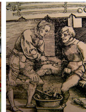
Cauterisieren mit Brenneisen

Der Austritt des Blutes aus den Adern war zu allen Zeiten der Menschheitsgeschichte ein dramatisches Ereignis. In der Vorstellungswelt des Mittelalters hatte der Blutverlust eine besonders tiefgreifende Bedeutung. Leben und Tod hingen in unmittelbarer Beziehung von der Blutung ab. Da erscheint es nicht verwunderlich, wenn zu allererst Gott, die Sterne oder die Geister angerufen wurden, um eine Blutung zu stillen!