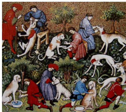
Hundebehandlung im Mittelalter