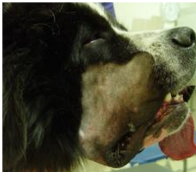
Abb. 1a rechte Seite vor der Operation

Manche Hunderassen haben rassebedingt sehr stark herabhängende Lefzen. Das kann vor allem bei sehr großen Hunderassen zu einer übermäßigen Salivation (Speichelfluss) führen. Der Speichel kann nicht mehr in der Maulhöhle gehalten werden und fließt direkt über die hängenden Lefzen ständig aus (Abb. 1a und 1b).