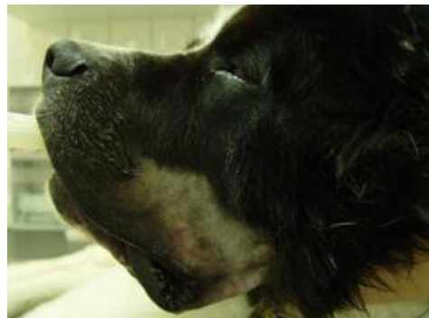
1.b linke Seite vor der Operation

Wir haben eine Operationsmethode entwickelt, bei der wir die Lefze chirurgisch begradigen und dabei nach oben ziehen, sodass der Speichel nicht mehr auslaufen kann. Da es sich um eine Naht in der Mundhöhle und auf der Haut unterhalb des Auges handelt, kann es allerdings in manchen Fällen zu einer frühzeitigen Nahtdehiszenz (Aufplatzen der Wundnaht) kommen und eine weitere Operation erforderlich werden.